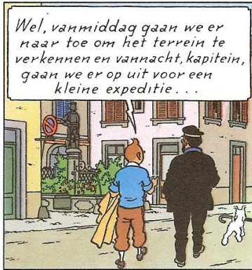
De kade in Nyon →

← Afdalend naar het centrum kom je langs het kasteel en bij de fontein met het standbeeld van Maître Jacques. Hij valt nauwelijks op, die oude vaandeldrager doordat een overijverige restauranthouder er een terrasje omheen heeft gebouwd.