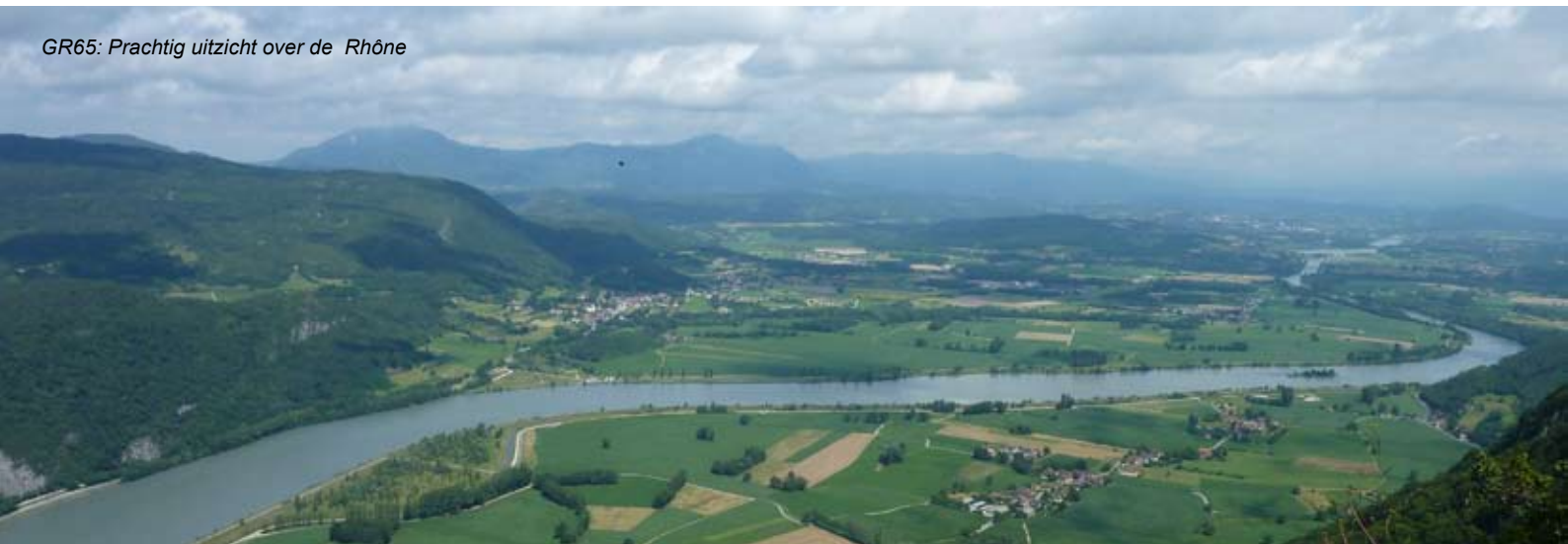
GR65: Prachtig uitzicht over de Rhône

Stel je geen prijs op deze nieuwsbrief, laat het via info@degr5telijf.nl even weten.