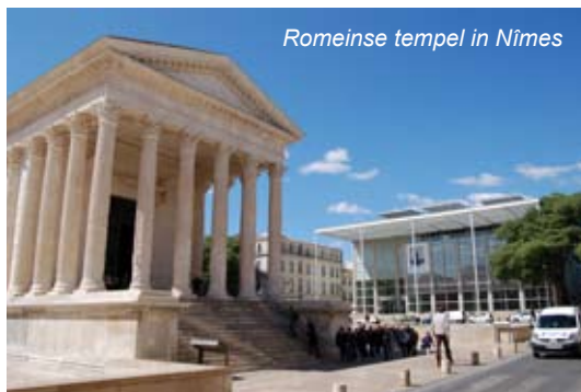
Romeinse tempel in Nîmes