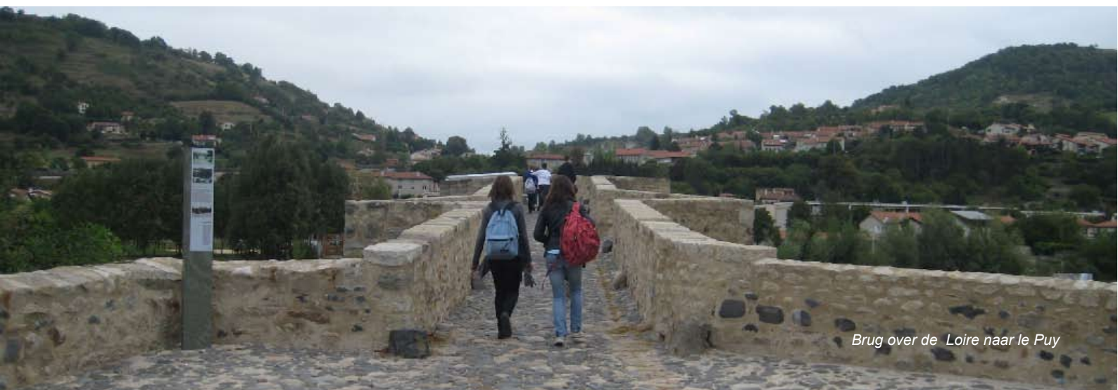
Brug over de Loire naar le Puy

Stel je geen prijs op deze nieuwsbrief, laat het via info@degr5telijf.nl even weten.