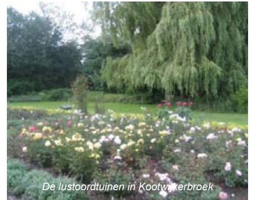
De lustoordtuinen in Kootwijkerbroek