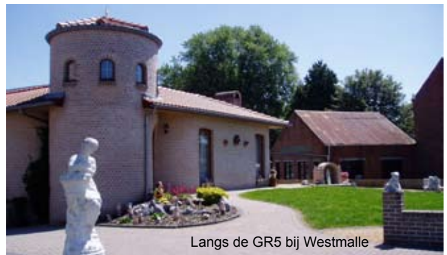
Langs de GR5 bij Westmalle

De traditie om aan onze wandelweken een fotowedstrijd te koppelen zetten we ook in 2010 voort. Dit jaar zal het thema zijn: Kastelen langs de GR5. Dit kan in de ruimste zin van het woord worden geïnterpreteerd, want zoals de Fransen zeggen: 'Ma maison est mon château'. Je kunt je inzending sturen naar info@degr5telijf.nl . De winnaar wordt beloond met de enige echte GR5-te-lijf-kalender.