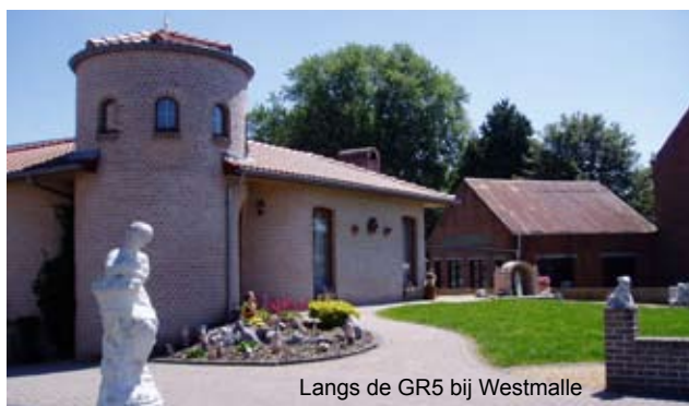
Langs de GR5 bij Westmalle

De traditie om aan onze wandelweken een fotowedstrijd te koppelen zetten we ook in 2010 voort. Dit jaar zal het thema zijn: Kastelen langs de GR5. Dit kan in de ruimste zin van het woord worden geïnterpreteerd, want zoals de Fransen zeggen: 'Ma maison est mon château'. Je kunt je inzending sturen naar info@degr5telijf.nl . De winnaar wordt beloond met de enige echte GR5-te-lijf-kalender.