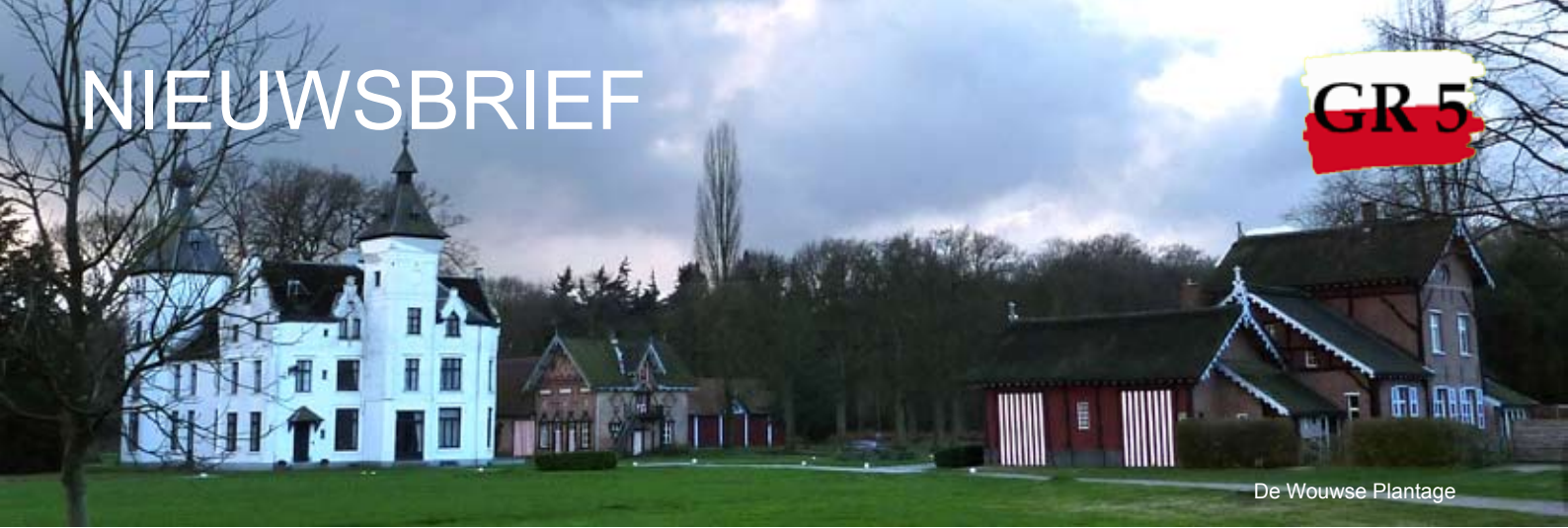
De Wouwse Plantage